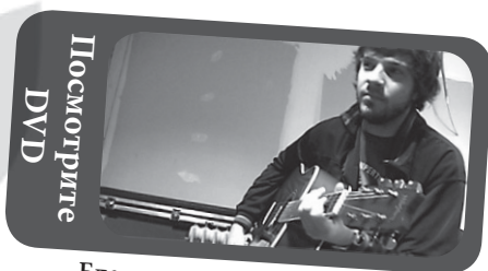
Благовествование | Филипп