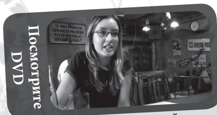
Новая жизнь во Христе | Йитка